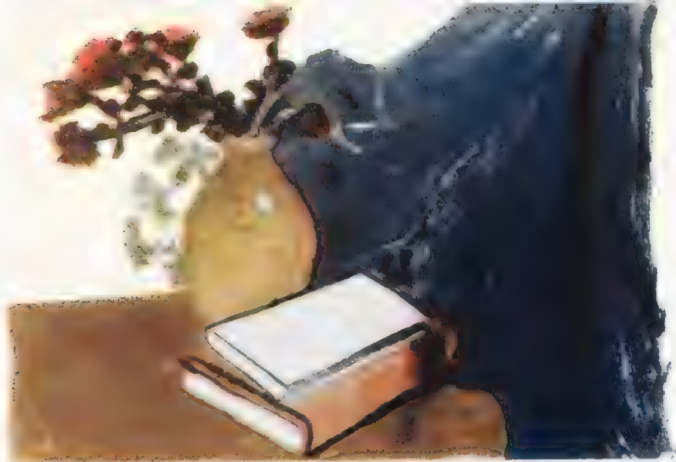
Autumnal Still Life